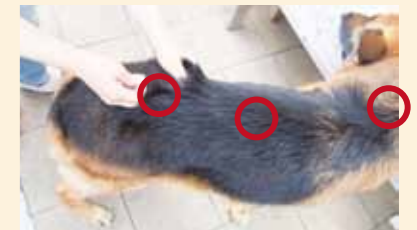
(赤丸部分周辺から採取して下さい。)

採取から送付までに時間がかかる場合、細胞の劣化を防ぐため、高温多湿となる場所を避けて保存してください。